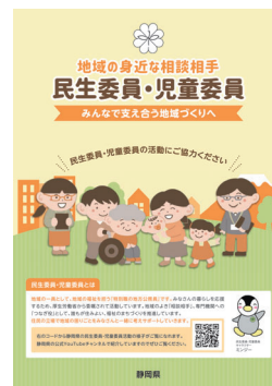
静岡県の民生委員パンフレット