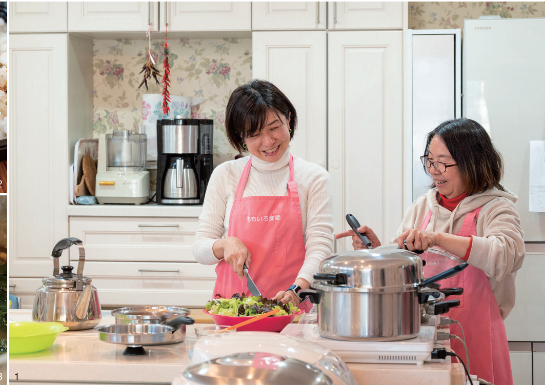
1.手際よく調理を進めていくTEAMももいろの皆さん。2.高齢者へ届けるお弁当も作ります。3.大鍋からおいしい湯気が漂います。