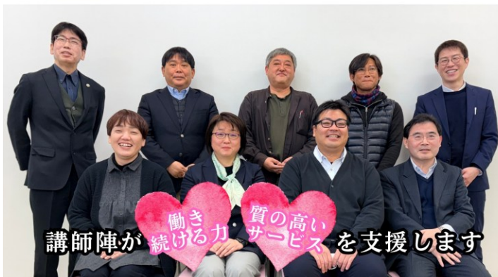
講師陣が 働ける力 質の高いサービスを支援します