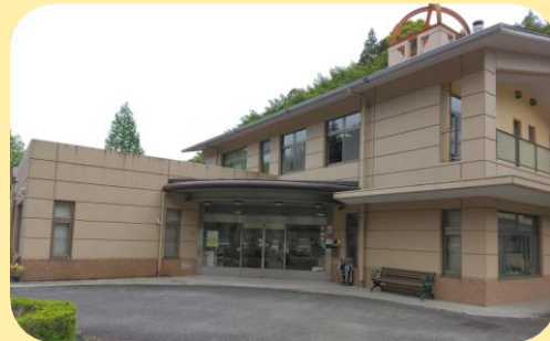
牧ノ原やまばと学園 垂穂寮