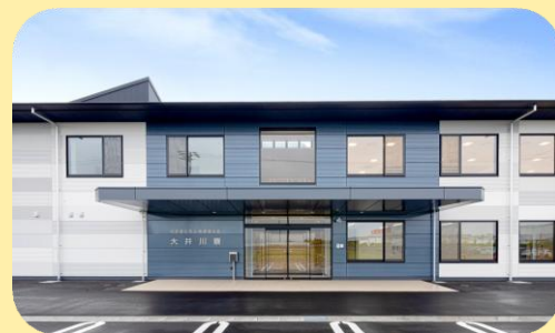
焼津福祉会 大井川寮