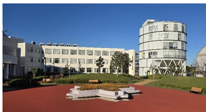
静岡福祉大学 焼津市本中根549-1