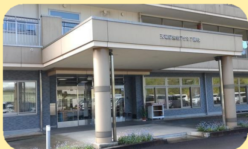
天竜厚生会天竜厚生会 アクシア藤枝