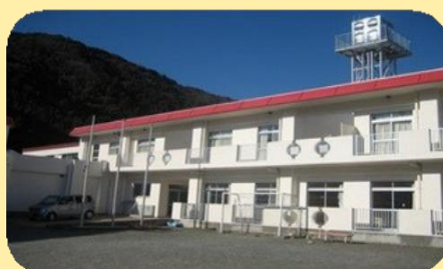
駿遠学園管理組合 駿遠学園