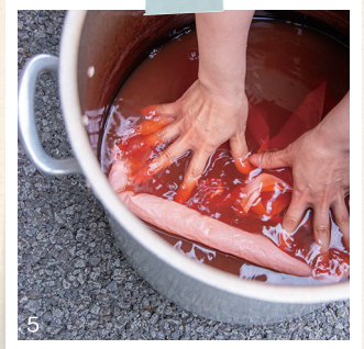
1.ライ麦のヒンメリとストロー。2.畳のへりを用いたポーチ類。3~5.白びわ染のアイテムは土肥の高級ホテルで愛用されている。葉ではなく木と枝で染め、季節によってピンクの色合いが微妙に変化するそう。