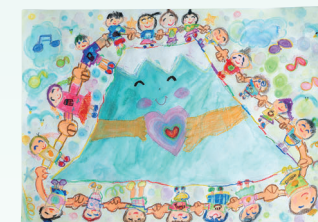
しずおか健康長寿財団理事長賞