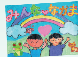
静岡県経営者協会会長賞