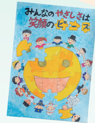
静岡県商工会議所連合会長賞