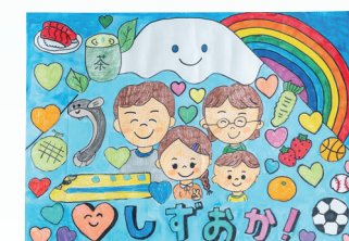
静岡県農業協同組合中央会長賞