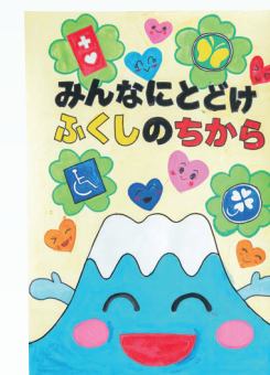
静岡県中小企業団体中央会長賞