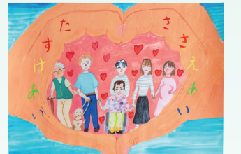
静岡県銀行協会会長賞