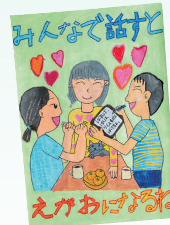
静岡県町村会長賞