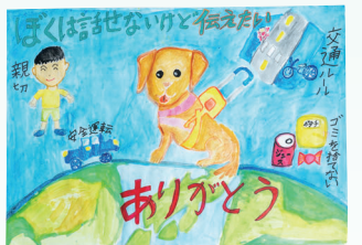
静岡県商工会連合会長賞