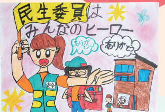
静岡県健康福祉部長賞