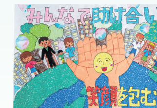
静岡県共同募金会長賞