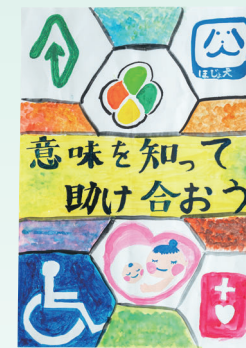
静岡県社会福祉協議会長賞