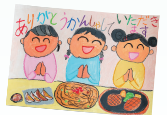
静岡県健康づくり食生活推進協議会長賞