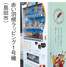
赤い羽根ランベーター1号機 (島田市)

売り上げの一部が寄付される自動販売機は、病院や学校、駅、ショッピングモールなど県内に約500台あります。