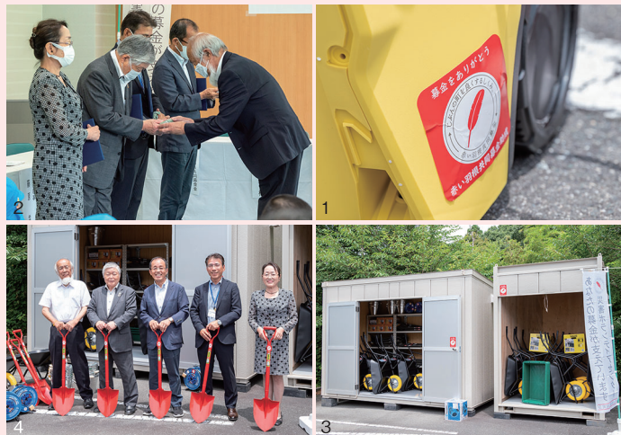
1.赤い羽根シールの付いたものは全て共同募金の助成による災害用機器です。2.覚書締結式では、関係者によるストックヤードの鍵の受け渡しが行われました。3.慶成会敷地内に設置されたストックヤード。「高台にあるから安心」との声も上がりました。4.締結式に出席した関係者が外に出て、実際にストックヤードを確認。

地域の安心感にも繋がる 災害ボランティア活動用機器の整備。 ストックヤードは浜松市の 社会福祉法人慶成会に。