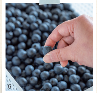
1.こだわりの材料で作るマドレーヌ。2.竹皮のブックカバーと菜。3.竹皮を織り上げる工程は熟練の技が必要。4.大粒のブルーベリーコンフィチュールは希少な限定商品。5.栽培・収穫も自分たちの手で。