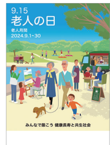
[ポスター制作] 全国社会福祉協議会

老人の日(社会福祉法第5条): ひろく国民が老人の福祉についての関心と理解を深め、かつ、老人が自らの生活の向上に努める意欲を高める日。