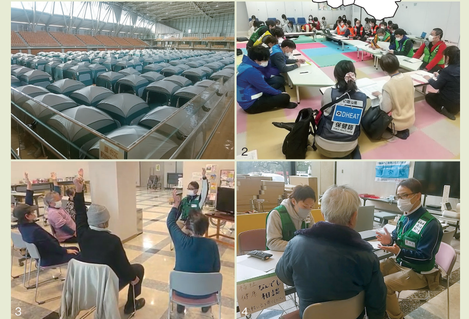
1.1.5次避難所内のテント。2.支援者ミーティングでの情報共有。3.健康体操の実施。4.相談コーナーを開設。