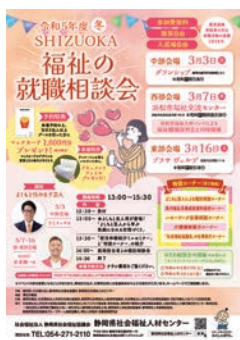
福祉の就職相談会