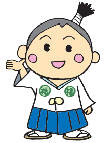
静岡県社会福祉人材センター イメージキャラクター「ふくしんぼうし」

福祉人材センターは、社会福祉法に基づき、福祉人材確保のために都道府県知事の指定を受けて、都道府県社会福祉協議会に設置されている公的な機関です。