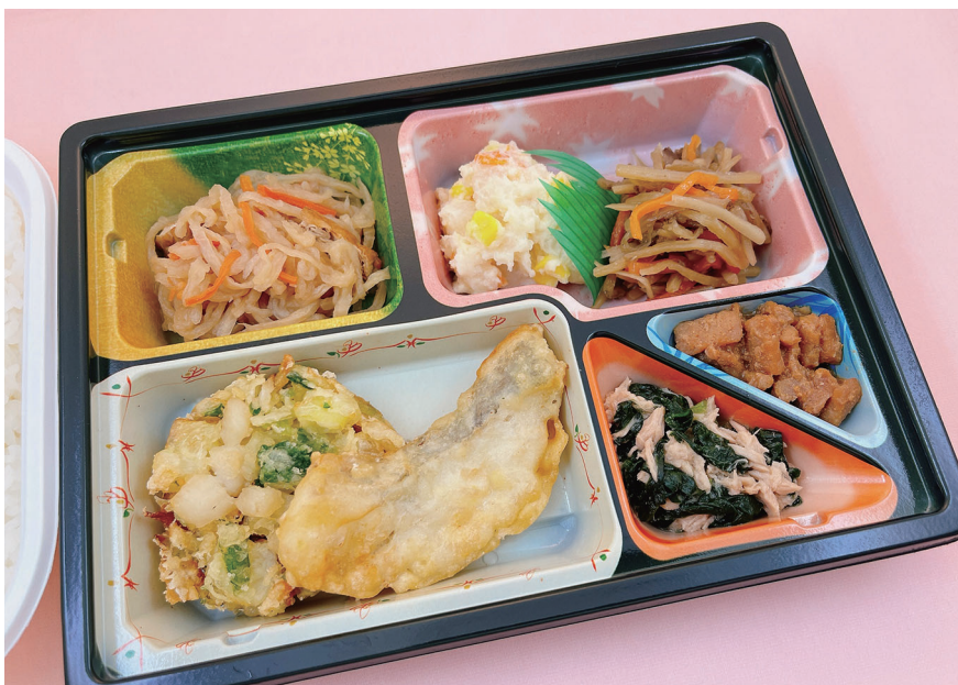
10月のご馳走の日は、「青森県産真鱈の天ぷら」と「青森県産ホタテと野菜のかき揚げ」弁当。

お弁当の容器にもこだわり、握力が弱くても開けられるよう蓋のツマミ部分を大きくしたり、軽く持ちやすい形状にしたり、おかずをスプーンで楽にすくえる角度も工夫しています。食べる喜び・楽しみを大事にして、月に1回、思わず人に