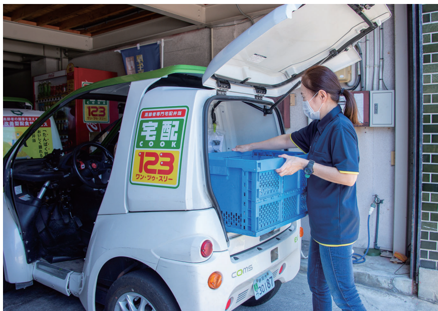
訪問軒数は1日80～90軒。配達エリアは静岡市内全域（一部山間部は除く）。

宅配クック123の「123」は「向う三軒両隣」を意味し、「近所さんのように、安心できて頼りになる存在でありたい」という意志が込められています。どのように行うかと、配達員がお弁当を利用者に手渡しし、声を掛け、見守り