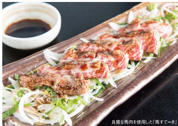
良質な馬肉を使用した「馬すてーき」

体の不自由な方の目線に立ったお店作りに注力。車椅子のままテーブルにつけて、トイレも十分な広さがあり、手すりに加え引き寄せ布も備えたバリアフリー対応。介護福祉士も在籍しています。厳選した素材を使う寿司のほか、オリジナル肉料理やお酒も豊富。安心して美味しいお食事を。