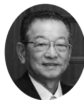
伊豆市 民生委員児童委員協議会