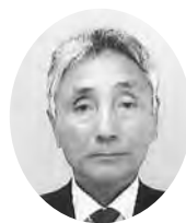
沼津市 民生委員児童委員協議会