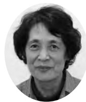
牧之原市 民生委員児童委員協議会