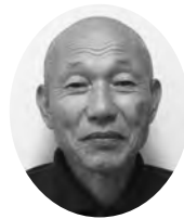
森町 民生委員児童委員協議会