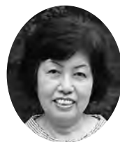
東伊豆町 民生委員児童委員協議会