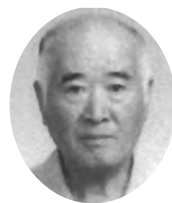
松崎町 民生委員児童委員協議会