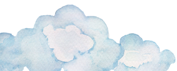
表 彰：応募作品の中から、優秀賞が選ばれ、展示されます。子どもたちの感性あふれる力強い作品や、日常のきらめきを捉えた写真など、多彩な作品が集まります。